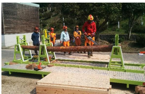
風倒木伐採訓練装置