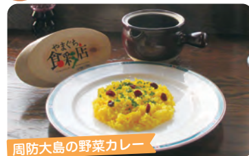
周防大島の野菜カレー