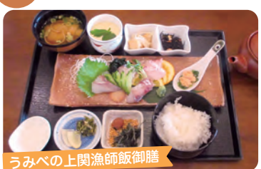
うみべの上関漁師飯御膳