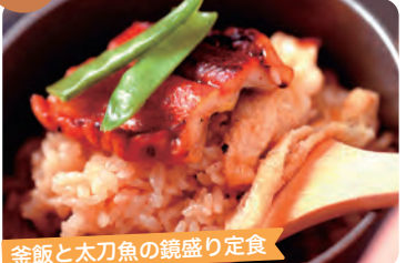
釜飯と太刀魚の鏡盛り定食