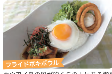
フライドポキボウル