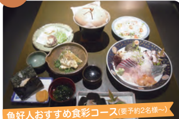
魚好人おすすめ食彩コース(要予約2名様~)