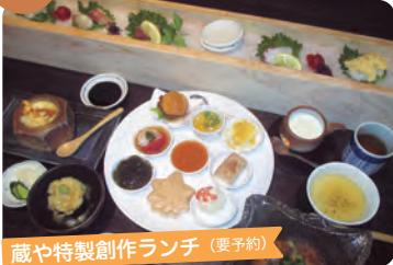
蔵や特製創作ランチ (要予約)