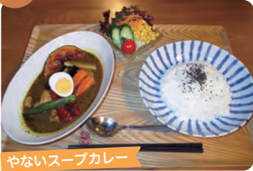
やないろスープカレー