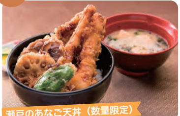
瀬戸のあなご天丼 (数量限定)