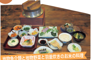
地物魚介類と地物野菜と羽釜炊きのお米の料理