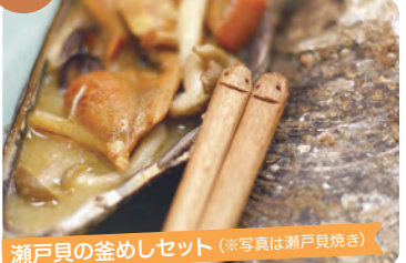
瀬戸貝の釜めしセット (※写真は瀬戸貝焼き)