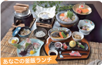
あなごの釜飯ランチ