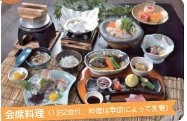
会席料理 (1泊2食付、料理は季節によって変更)