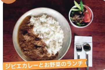
ジビエカレーとお野菜のランチ

築120年の古民家カフェでのんびりお過ごしください。Facebookページあります。