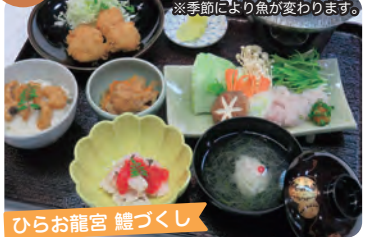
※季節により魚が変わります。 ひらお龍宮 鯉づくし