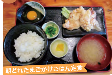
朝どれたまごかけごはん定食