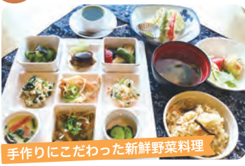
手作りにこだわった新鮮野菜料理