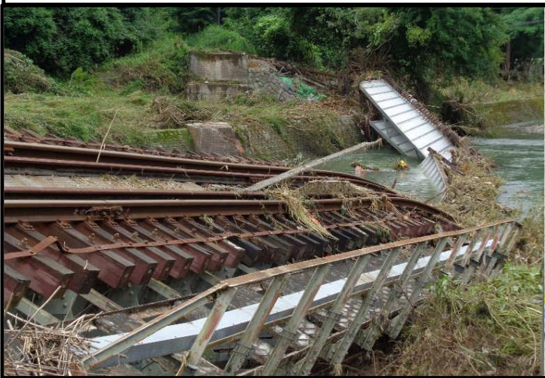
第6厚狭川橋梁 (橋梁流失)