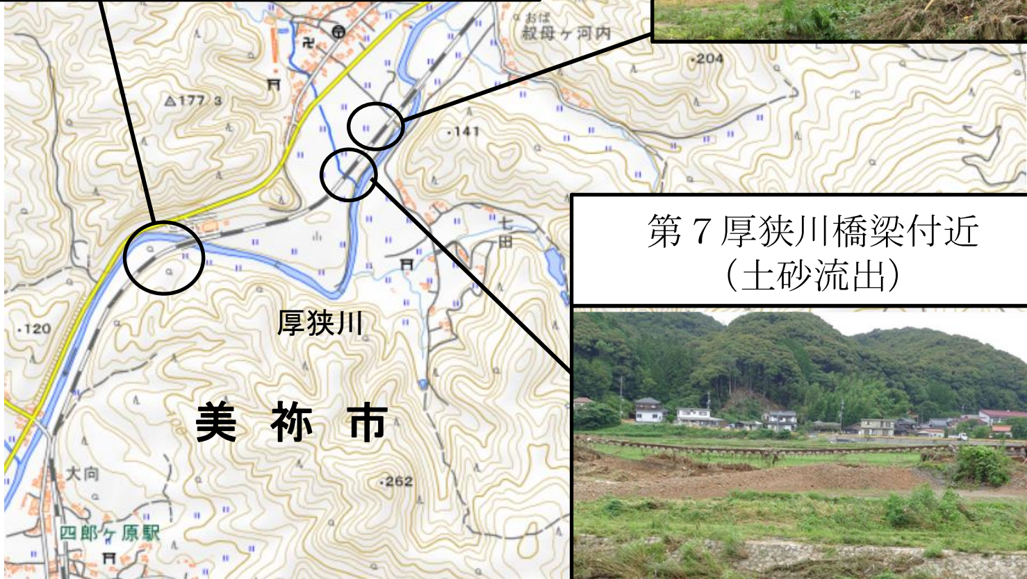
第7厚狭川橋梁付近 (土砂流出)