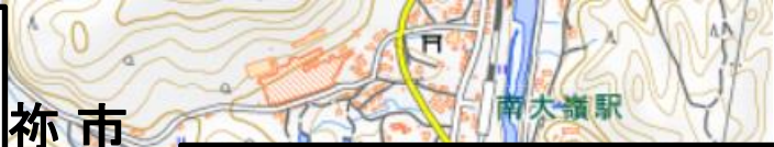
第7厚狭川橋梁付近 (信号通信機器損傷)