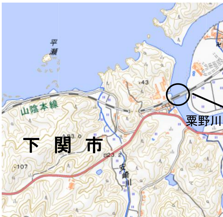
栗野川橋梁 (橋脚傾斜)