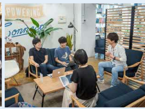
ガイアックスの過去のイベント

日時：2023. 8.5 (土) 第1部 14:00～17:00 第2部 18:30～アイデア出るまで 会場：第1部 山口市湯田地区会場 第2部 西の雅常盤（山口市湯田温泉）