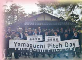
松下村塾での最終成果発表会（R4年度）