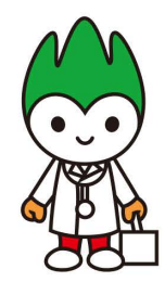
山口県PR本部長「ちよる」

TEL 083-922-2510 E-mail info@yamaguchi.med.or.jp