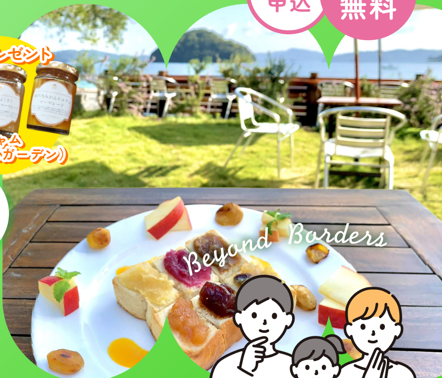
ジャムズガーデン(周防大島)