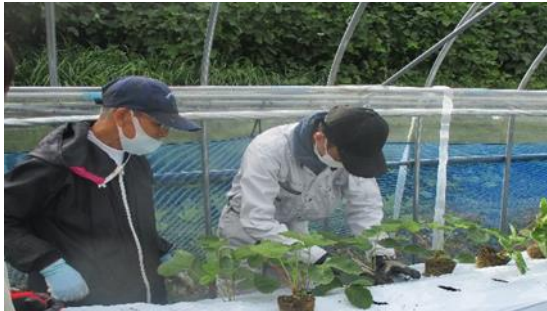
いちご作業体験研修

就農ガイダンス、産地ツアーや各地域の営農塾等で新たな担い手候補の掘り起こし活動を支援するとともに、各種支援策を効果的に活用し、新規就農者等の確保・育成を進めます。