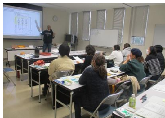
柳井・大島地域農業女子会