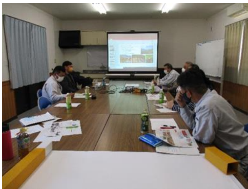
集落営農法人の雇用に向けた勉強会

新たな集落営農法人の設立や農外企業参入を進め、集落営農法人連合体と連携し、地域の中核となる組織経営体の育成を図るとともに、経営の規模拡大や複合化・多角化に向けた取組支援と併せて、効率的な土地利用型農業の実現に向けた生産構造の改革を進めます。