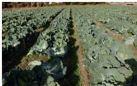
加工業務用キャベツの栽培

キャベツなどの土地利用型野菜の低コストで効率的な生産体制の構築を図るとともに、価格安定に向けた販売体制の構築に取り組み、産地拡大を進めます。