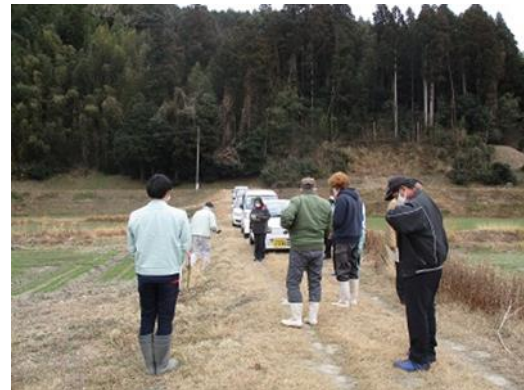
集落営農法人における小麦の生育状況の確認