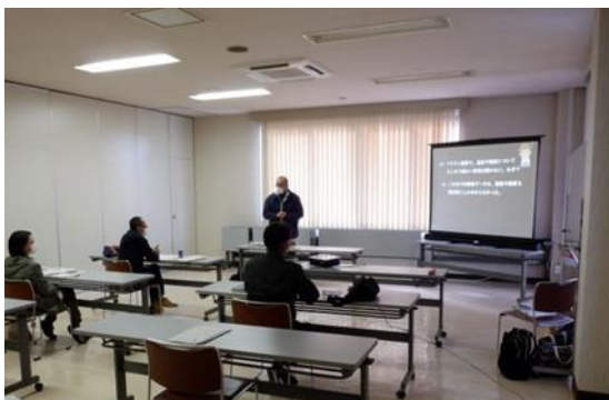
いちご栽培講座の開催

いちごやアスパラガスなど施設野菜の栽培技術の向上や販売対策、後継者確保に取り組むことにより産地拡大を進めます。