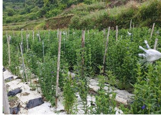
リンドウ栽培の様子

やまぐちオリジナルリンドウ（西京シリーズ）の導入を推進し、栽培技術指導等を行うことで、産地拡大を進めます。