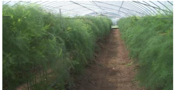
エコ農産物（アスパラ）の栽培状況

農業生産工程を適切に管理する認証制度である国際基準 GAP 等の導入を推進するとともに、化学農薬・化学肥料の使用を50%以上削減した「エコやまぐち農産物」の認証等を活用し、農産物の安心・安全の確保を進めます。