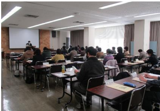
柳井地域農山漁村女性のつどい

地域の主要な担い手である農山漁村女性が主体的に活動に参画できる環境や体制を整え、農山漁村女性リーダーの育成をすすめます。また、農業経営に取り組む若手女性に対し、ネットワーク構築や能力向上に向けた研修会を開催し、自信とやりがいをもって農業に取り組める女性を育成します。