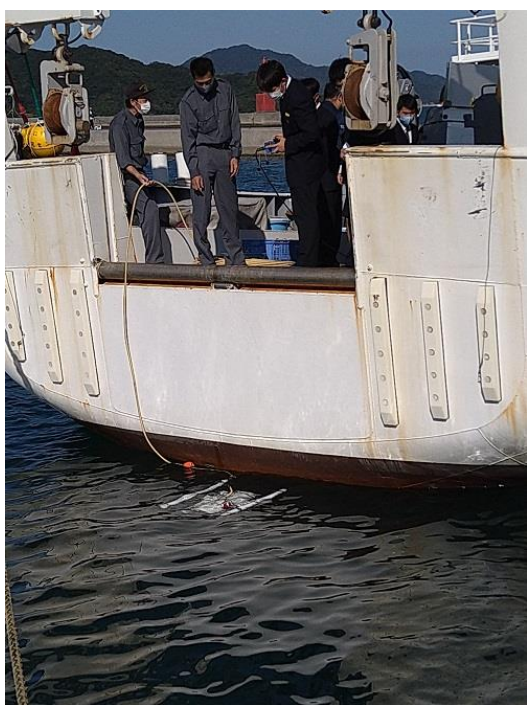
○船尾にて、ROV（自走式水中テレビ装置）のオペレーションを行う生徒