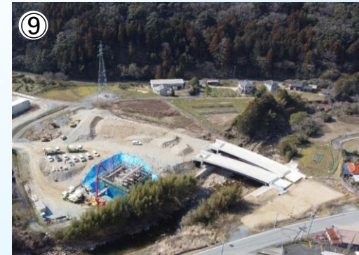
⑨ 12号橋、オン・オフランプ橋の状況