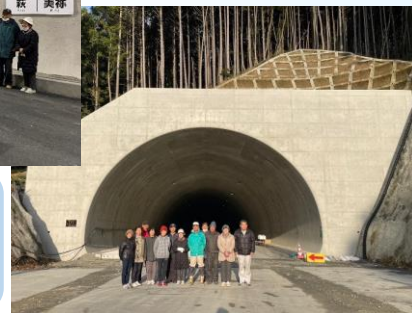
完成したばかりのトンネルをバックに記念撮影

地域の方々のご理解とご協力のおかげで、無事に工事を終えることができました。有り難うございました！