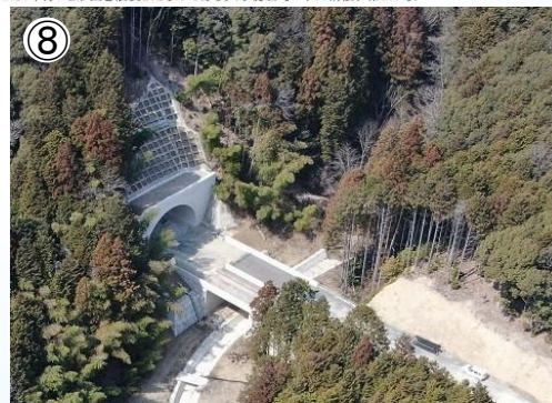
⑧ 3号トンネル、11号橋の状況