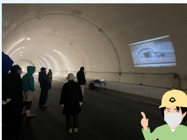
施工時の様子をトンネル内で放映

トンネルの完成を記念して、地域の方々を対象とした見学会「完成ウォーキング」を開催しました。（自動車専用道路となるため、開通後は歩くことはできません！）