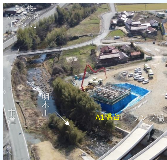
令和5年2月の施工状況