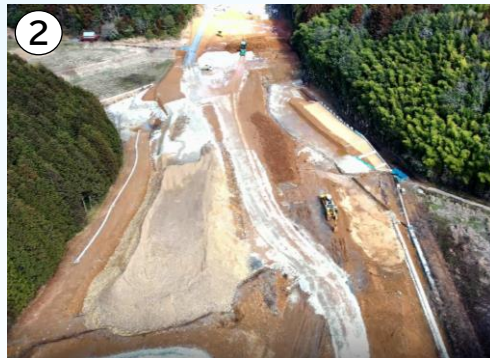
② (仮)絵堂北 I C 付近の施工状況