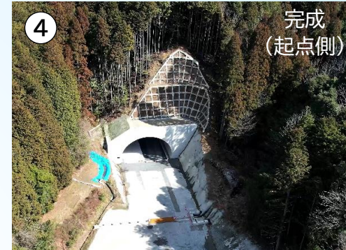
④ 雲雀山(2号)トンネルの状況