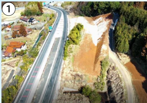
① 絵堂 I C 付近の施工状況