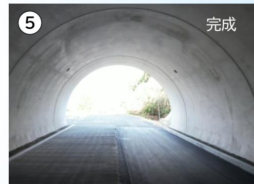
⑤ 雲雀山(2号)トンネルの状況

この地図は、国土地理院長の承認を得て、同院発行の2万5千分1地形図を複製したものである。(承認番号 平30情複 第869号)