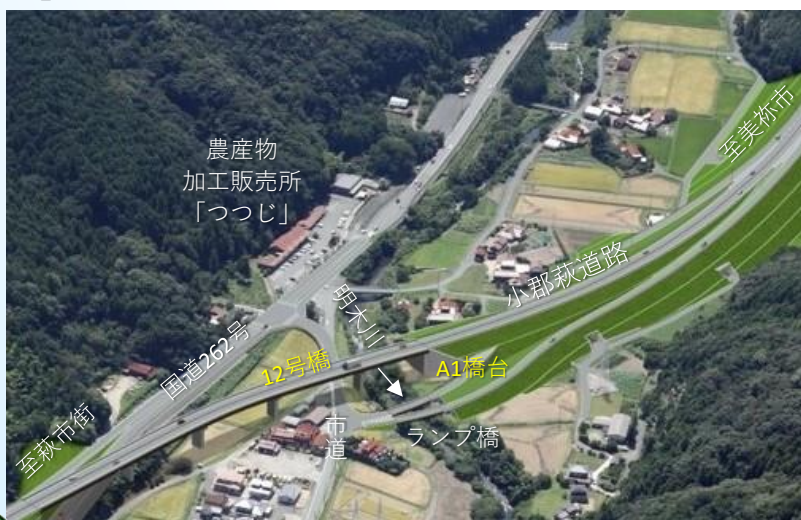
（仮）明木IC付近 完成予想図

明木川や国道262号等の上空を横断する「12号橋」（延長約288m）の工事に着手しました。令和5年2月時点において、12号橋の最も起点側（美祢市側）で橋梁を支える「A1橋台」を施工中です。