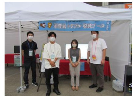
〔学生消費者リーダーの啓発活動〕