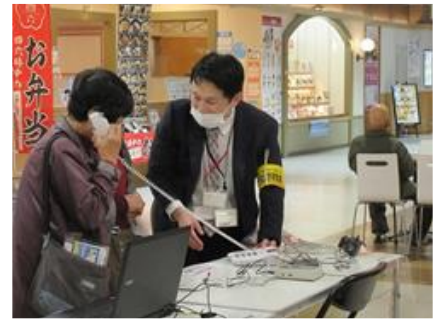
〔悪質電話勧誘等被害防止 キャンペーン〕