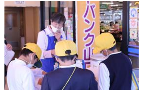
〔フードバンクの取組を社会見学で説明〕