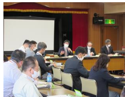
〔188見守りネットワーク連携会議〕