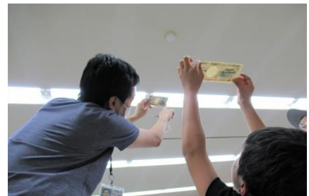
〔親子のためのおかね楽習 フェスタ in ひかり〕