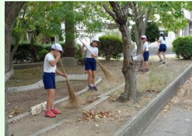
全校生徒による「落ち葉拾い大作戦」