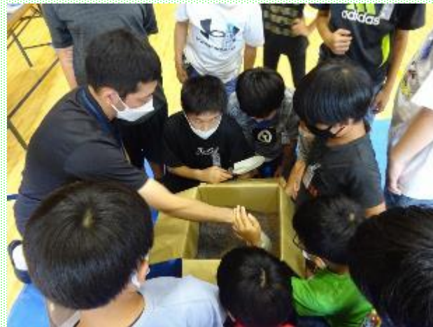
ダンボールコンポスト開始の様子