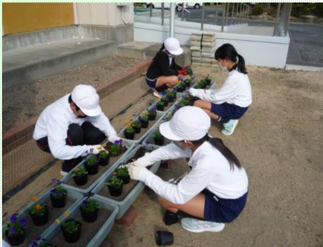
花の苗植えの様子