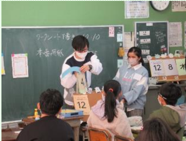
梅光学院大学と地元企業の共同による「SDGs」について学ぶ課外授業