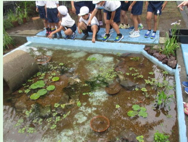
「めだかの学校」として生まれ変わった ビオトープ