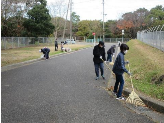
桃山中学校区（小羽山小学校区）で、児童生徒、保護者、地域の方と清掃活動を行った。