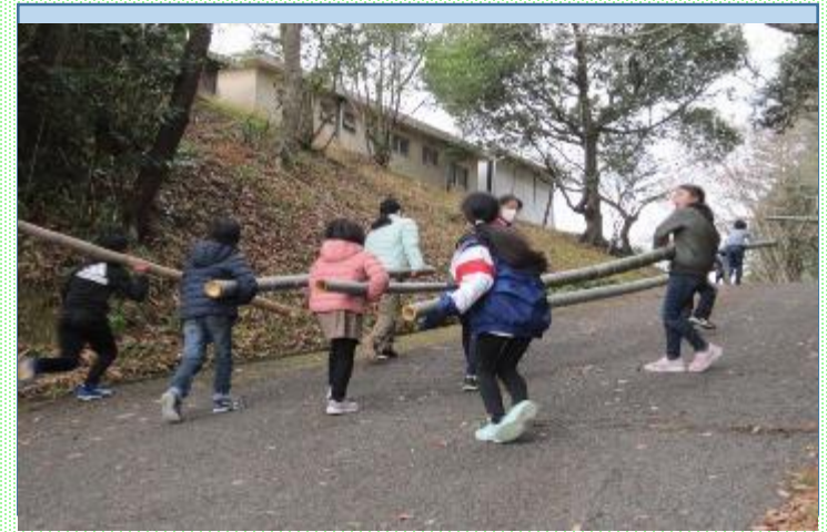
地域の竹林ボランティアの方々と 協力した竹林の整備