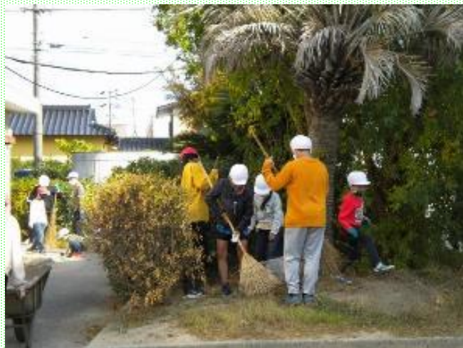
ペア学年による秋のクリーン作戦