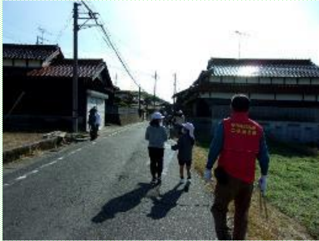
地域クリーン活動