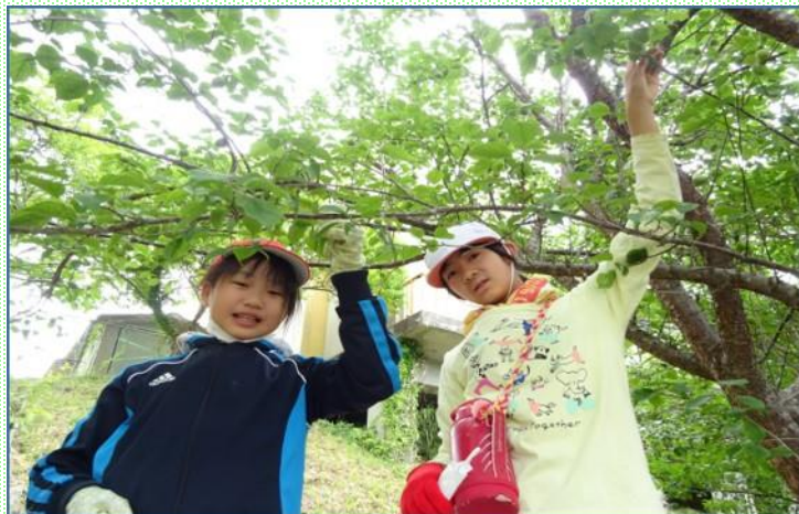
梅園の除草作業、梅もぎ、剪定、販売