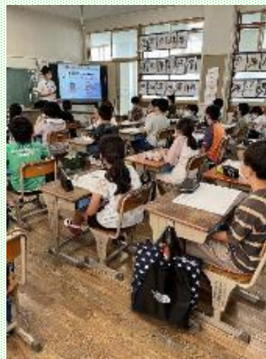
4年生の水育の学習