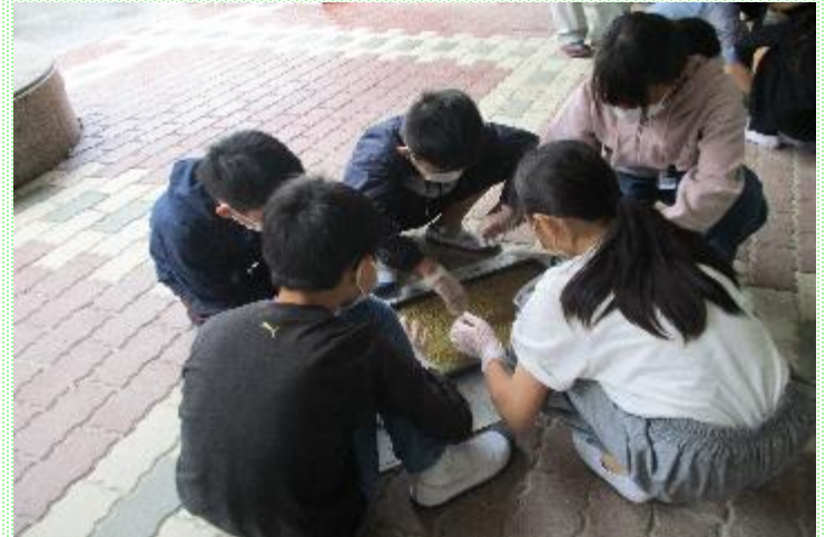
もち米のもみまき