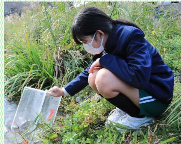
ホタルの幼虫の放流