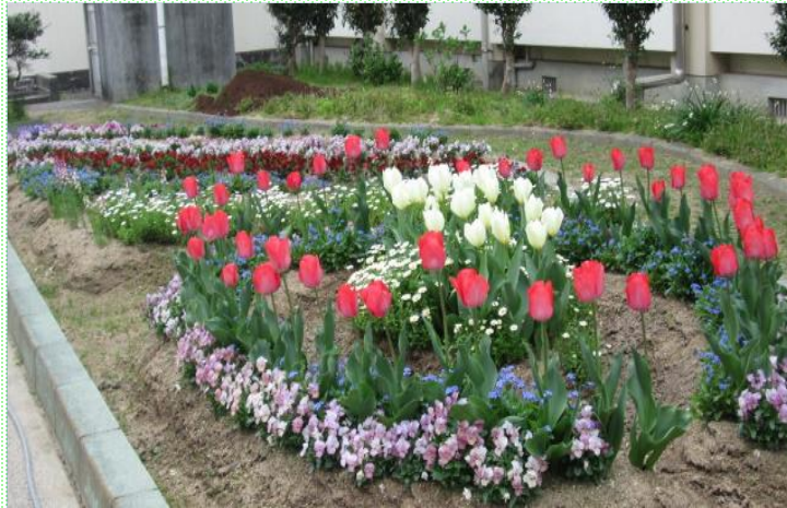
花壇デザインコンテストによる児童のアイデアを生かした学校花壇づくり