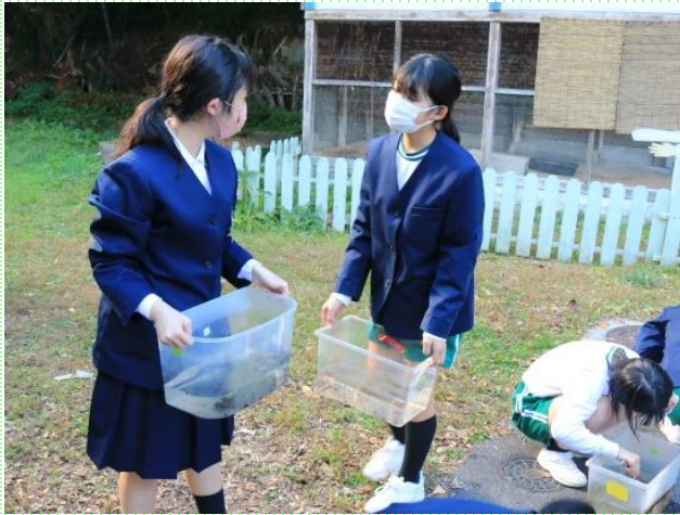
ホタルの世話をして、成長の様子を記録