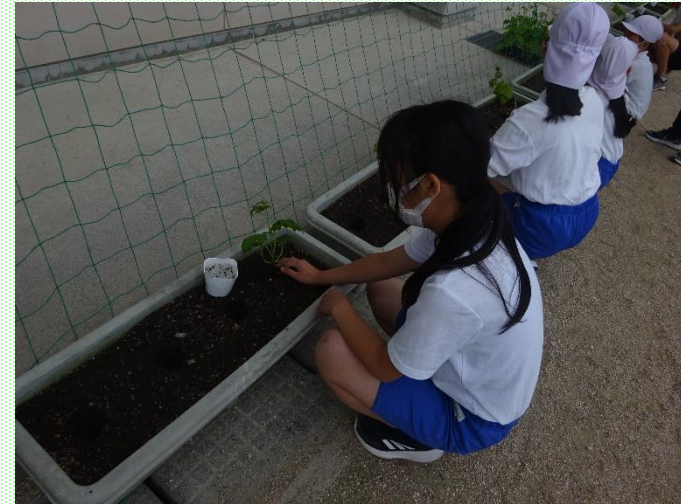
園芸委員会によるグリーンカーテンの 苗植え・水やり