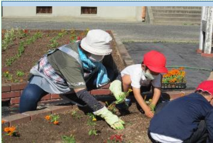
地域の花壇ボランティアの方々と 協力した花壇づくり