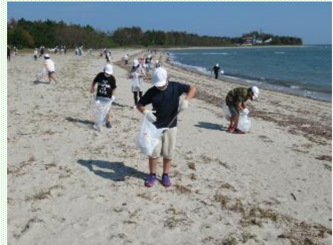
校区にある海岸清掃を通して、美しい海を守り続けることについて考えた総合的な学習の時間