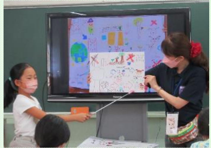
せかい！動物かんきょう会議：動物の目線になって、 今の地球環境の抱える問題とその改善策を考えた。