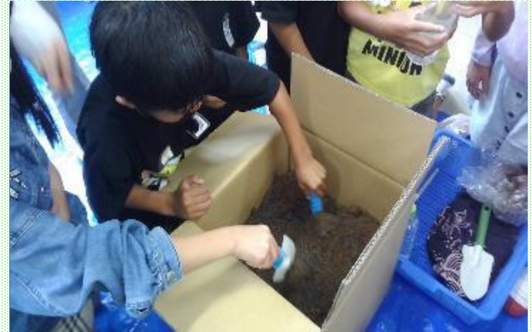
段ボールコンポスト