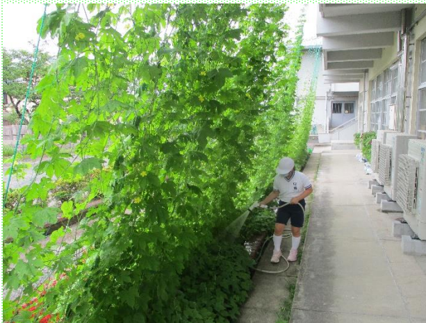
大きく育ったグリーンカーテン