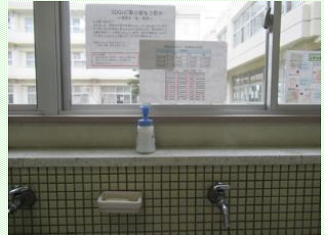
「SDGsについて学ぼう」（5年生・総合） ＜学校でできる取組について呼び掛け＞