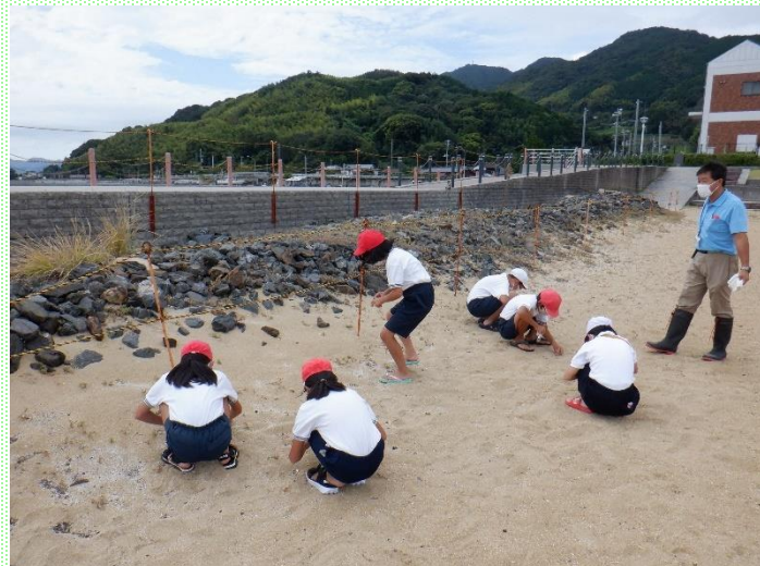
砂浜のマイクロプラスチック拾い