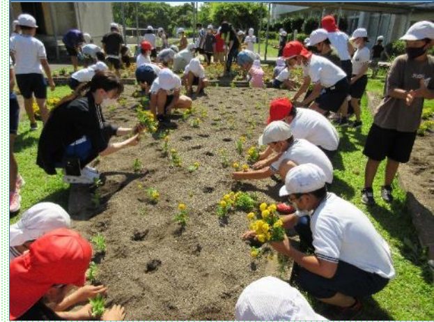
学年ごとに花壇に苗を植え、園芸委員会の児童や保護者と世話をした。