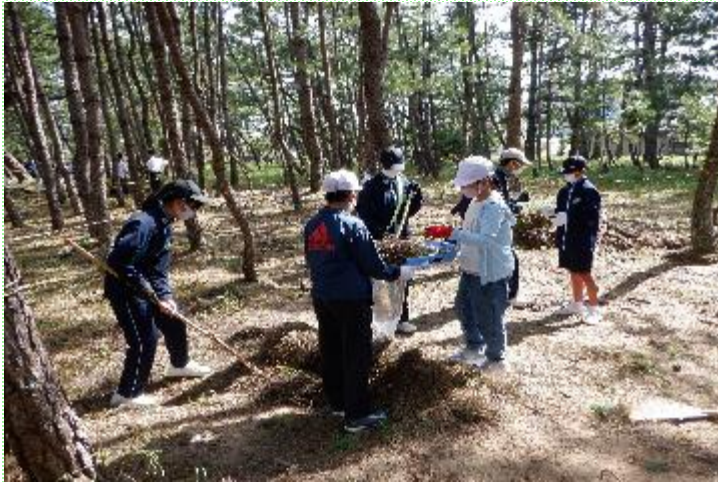
波雁ヶ浜保全活動