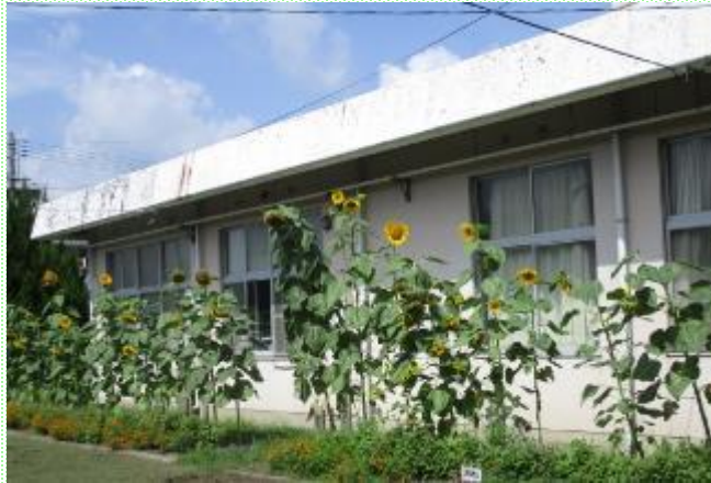
大きなひまわりを育て、種を来校者に配付