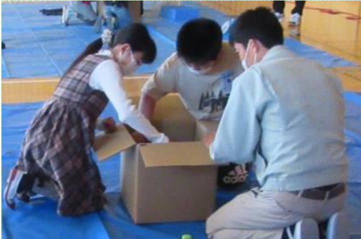
段ボールコンポストの意義を学び、 生ごみを堆肥化する活動（4年）