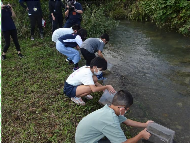
ゲンジホタルの幼虫の放流