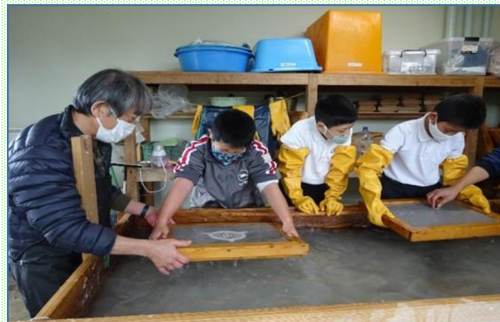
昔さかんだった和紙作りの手法で、自分の卒業証書の制作