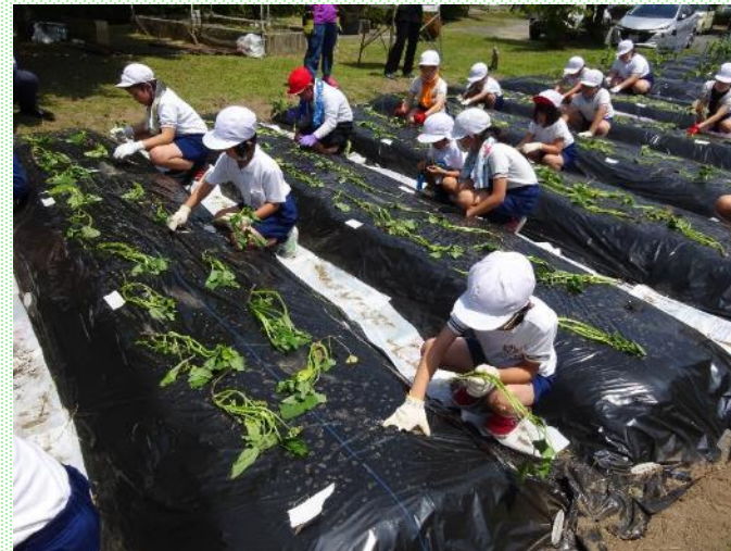
地域の方と芋の苗植えの様子