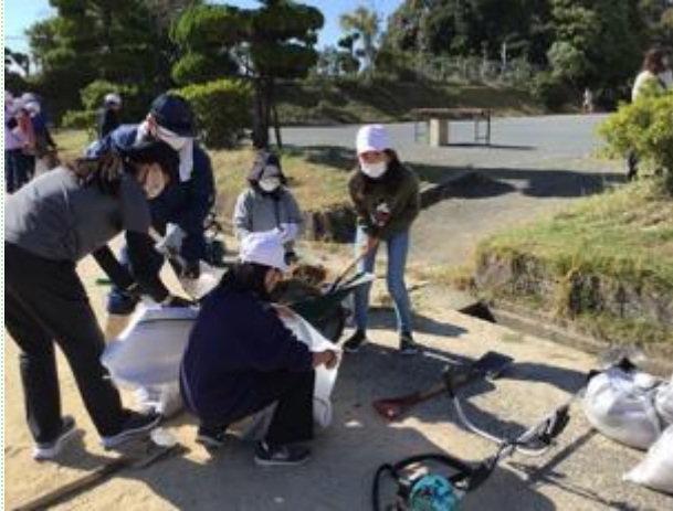
親子環境整備作業 ＜児童・保護者・地域の方が一緒に活動＞