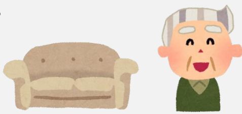
半額で購入できるなんてラッキー！

ネットで、有名家具店の在庫処分セール の広告を見つけた。公式の通販サ イトだと思い、 通常価格の半額 になっ ていたソファをクレジット決済で購入し た。