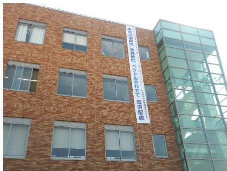
下関市環境部庁舎