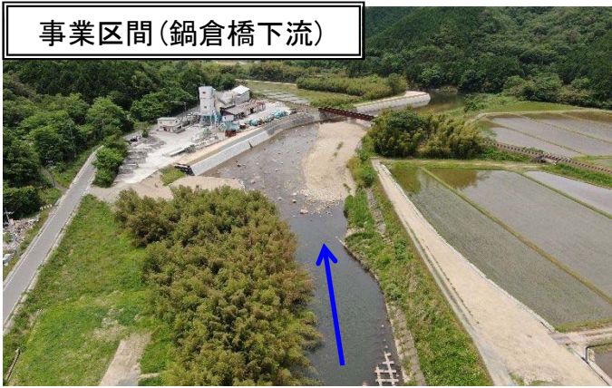
事業区間 (鍋倉橋下流)