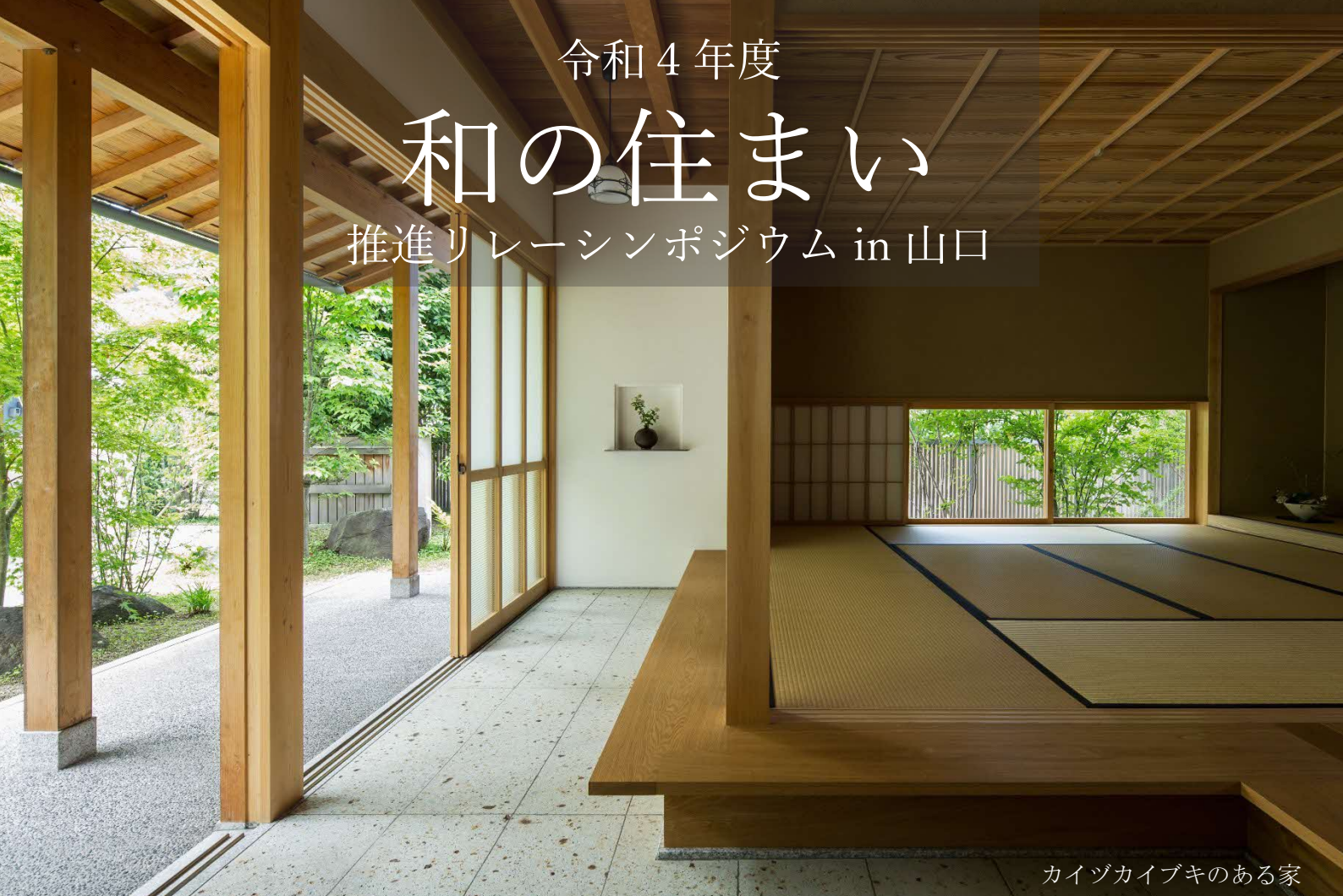
カイツカイブキのある家