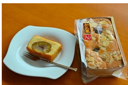
【菓子】 栗と木の実のパウンドケーキ コンデイトライHAKU