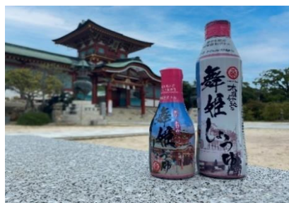
【農林産】 木桶仕込み 舞姫しょうゆ 桑田醤油有限会社