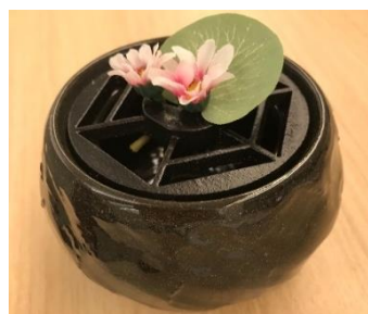
【工芸品等】 南蛮車 平野 豊成