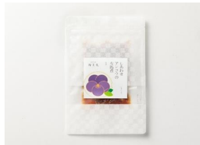
【水産】 しあわせ アンコウの有馬煮<胃袋> 株式会社寿美れ