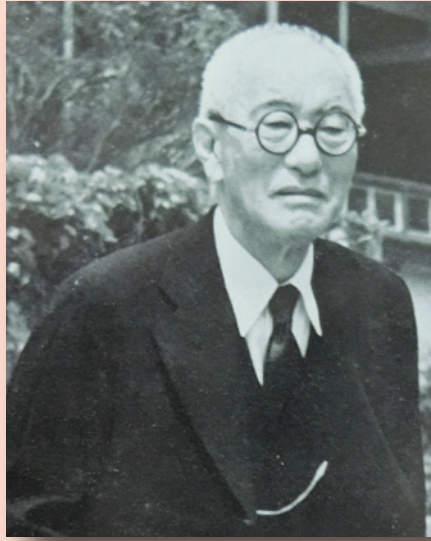
『雜司ヶ谷短信』上巻より