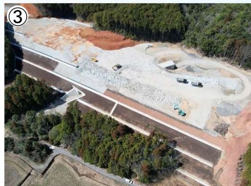
ボックスカルバート付近の施工状況