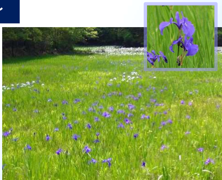
二反田ため池のカキツバタ