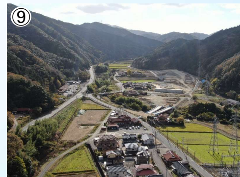
(仮)明木 I C ランプ橋付近の状況