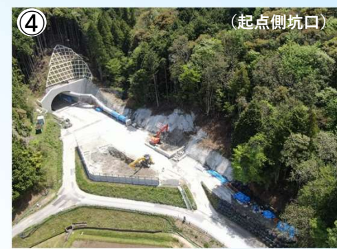
雲雀山(2号)トンネルの施工状況