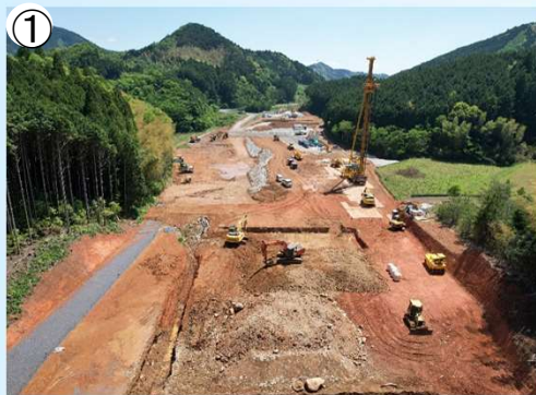
(仮)絵堂北 I C 付近の施工状況