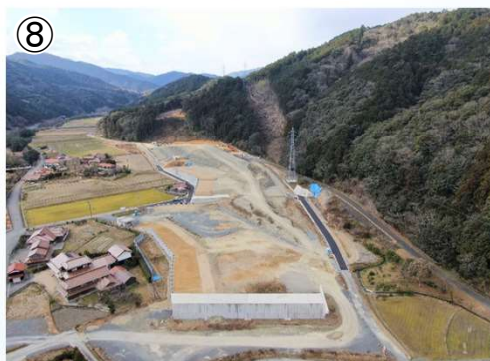
(仮)明木 I C 部の施工状況