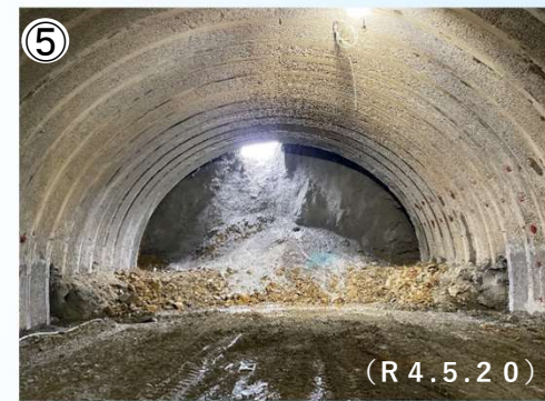
雲雀山(2号)トンネルの貫通時の状況

この地図は、国土地理院長の承認を得て、同院発行の2万5千分1地形図を複製したものである。(承認番号 平30情複、第869号)