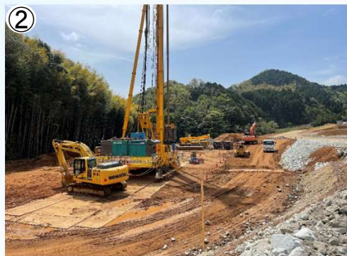
地盤改良工等の施工状況