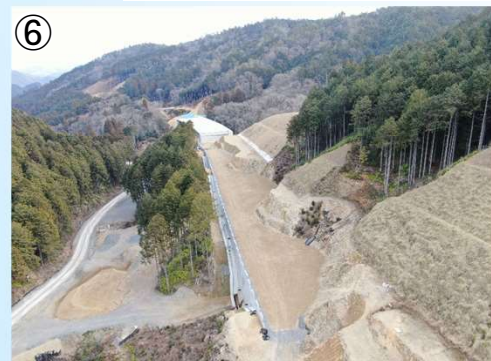
4号橋付近の施工状況