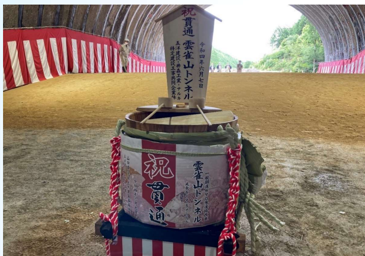
鏡開きに使用された祝い樽