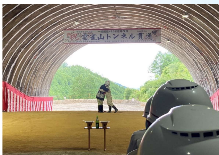
通り初めの儀・感動の熱い抱擁