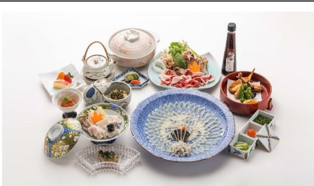
ふぐ&ジビエ (牡丹鍋) まる得コース 【10,000円(食事のみ)(税込)】 ※要予約 (3日前)

住所 下関市竹崎町 3-13-23 電話番号 083-222-3191 営業時間 11:30~14:00 17:30~22:00 定休日 不定休