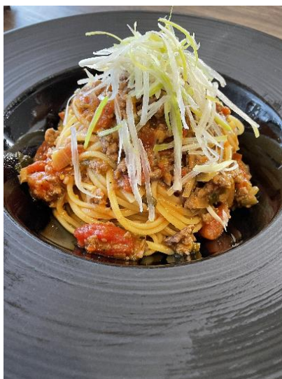
猪の和風ミートパスタ 【1,400円(税込)】

住所 岩国市麻里布町 3-13-13 MARIFUビル 1F 電話番号 0827-28-5299 営業時間 18:00~22:00 定休日 木曜日