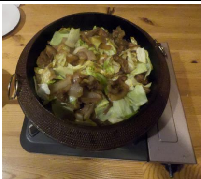
ししちゃん焼き ※要予約

住所 岩国市錦町広瀬 7873-9 電話番号 090-1189-0989 営業時間 17:00~22:30 定休日 月曜日、木曜日、 その他不定期休有