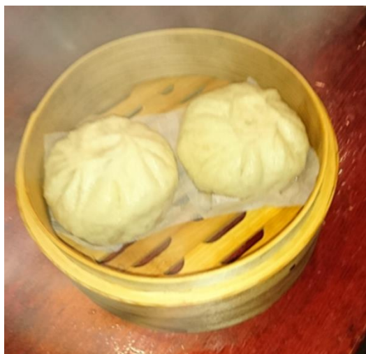
鹿ロースの肉まん 【300円/個(税込)】 ※要予約(10日前)