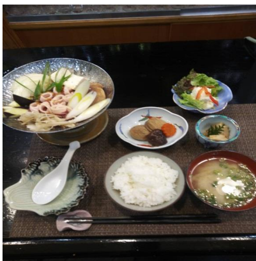
俵山猪山の幸御前