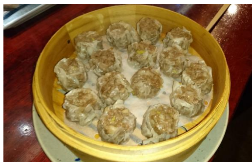
鹿モモ肉の焼売 【600円/6個(税込)】 ※要予約(10日前)