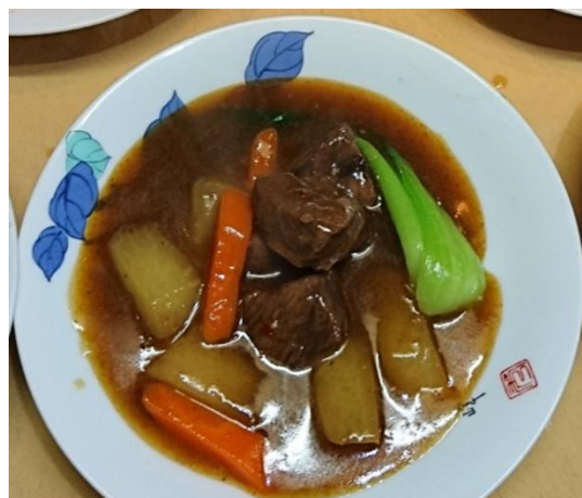
鹿モモ肉の四川風ピリ辛煮込み 【1,500円(税込)】 ※要予約(10日前)