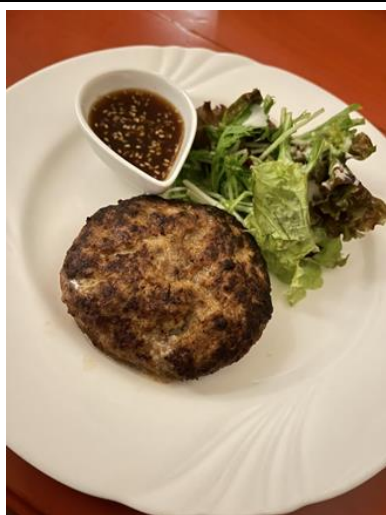
岩国市錦町産猪肉のハンバーグ 【1,800円(税込)】 ※要予約

住所 岩国市麻里布町 3-11-10 正広ビル2F 電話番号 0827-24-5066 営業時間 20:00~翌6:00 日曜営業 定休日 不定休