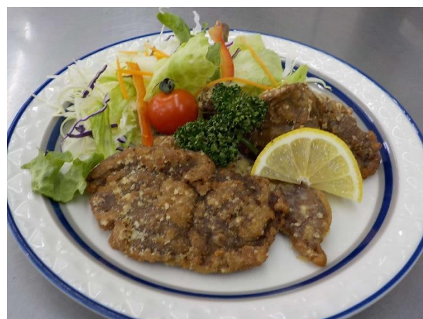
シカ肉の竜田揚げ