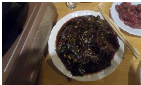
シカ焼肉 (たれ&塩レモン漬) ※要予約