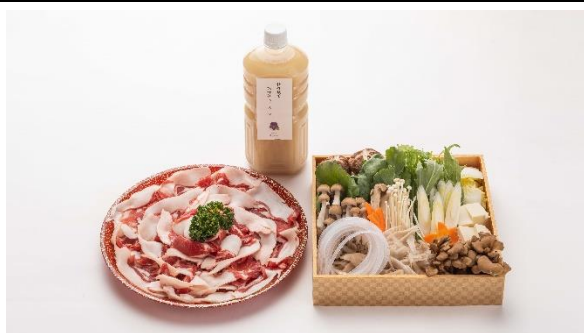
牡丹鍋 (宅配用) 【7,000円(税込)】 ※要予約 (3日前)