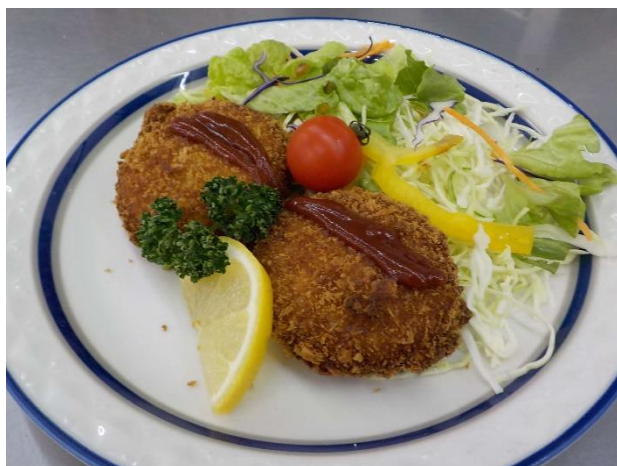
イノシシ肉のコロッケ

住所 下関市後田町 4-23-2 電話番号 090-1088-2074 営業時間 8:30~16:30 定休日 日曜日・祝日・年始