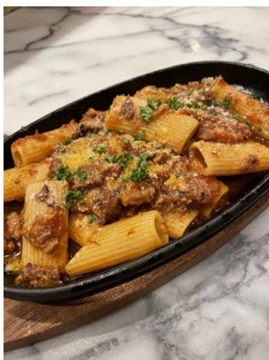
山口県産猪ラガー リガトーニ 【1,760円(税込)】

住所 岩国市麻里布町 2-3-21 電話番号 0827-35-4334 営業時間 【土・日・祝】 ランチ 11:30~14:00 (ラストオーダー13:00) 【火~日・祝】 ディナー17:00~22:00 (ラストオーダー21:30) 定休日 月曜日(祝日営業、翌火曜日休)