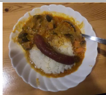
シカソーセージ添えレッドカレー ※要予約