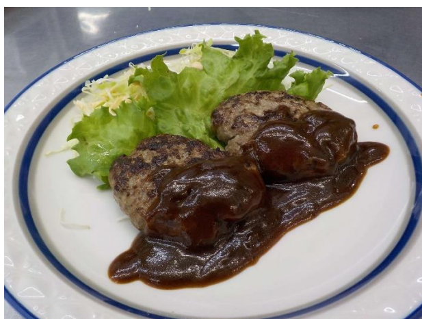
イノシシ肉のハンバーグ