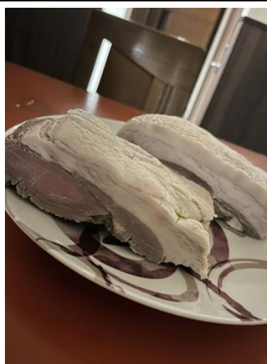
岩国市錦町産猪肉のロースハム(コース用) 【1,800円(税込)】 ※要予約