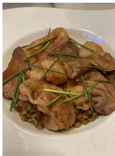
山口県産猪ロース肉のソテーとレンズ豆 【1,180円(税込)】