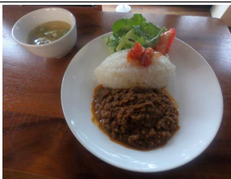
シカカレー ※要予約