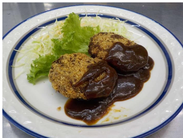
イノシシ肉のメンチカツ