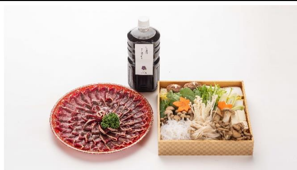
紅葉鍋 (宅配用) 【6,000円(税込)】 ※要予約 (3日前)