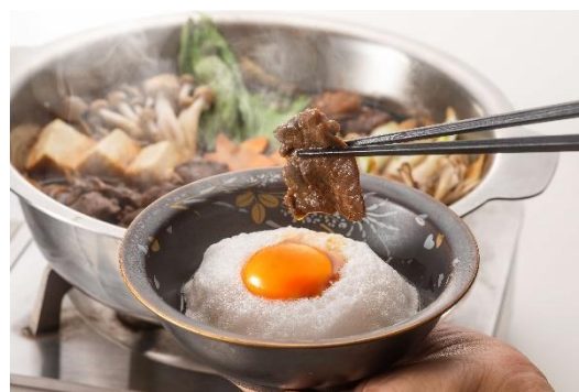
ふぐ&ジビエ (紅葉鍋) まる得コース 【10,000円(食事のみ)(税込)】 ※要予約 (3日前)