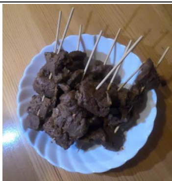
シシケバブ ※要予約