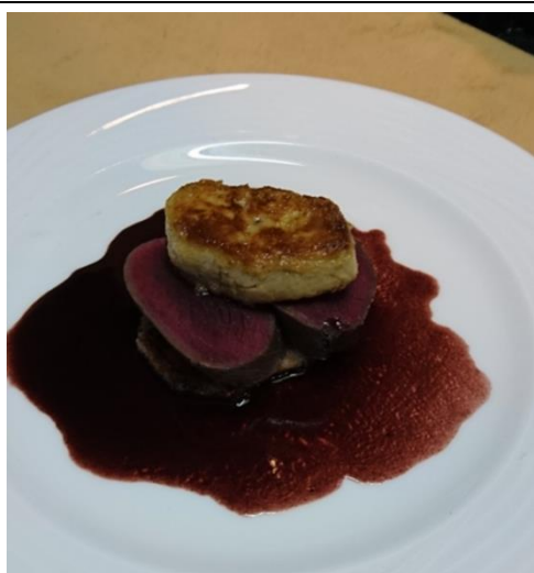
鹿ロースとフォアグラのロティ 赤ワインソース岩国蓮根のピューレ添え 【3,800円(税込)】 ※要予約(10日前)

住所 岩国市麻里布町 6-9-27 電話番号 0827-23-6686 営業時間 17:30~ 定休日 日曜日・祭日