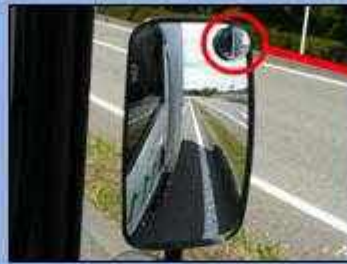
サイドミラーでは緊急車両を確認できない。