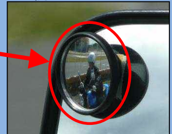
補助ミラーでは死角にいる自動二輪車を確認できる。