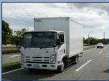
真後ろから緊急車両が接近中