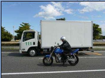
サイドミラーの死角にいる自動二輪車