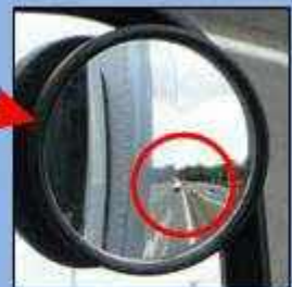
補助ミラーでは真後ろの緊急車両を確認できる。