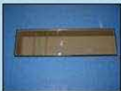
ワイドミラーの例