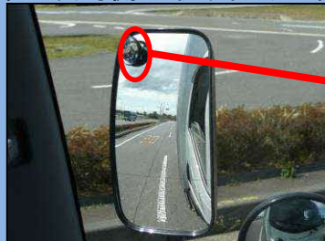
サイドミラーでは自動二輪車を確認できない。