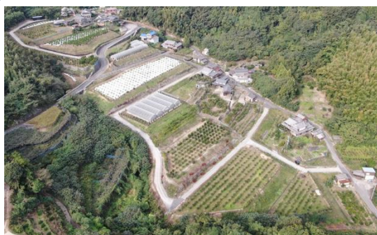
周防大島町久賀地区基盤整備ほ場