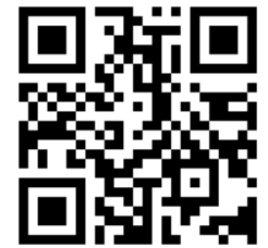
山口県ひとつづくり財団HP