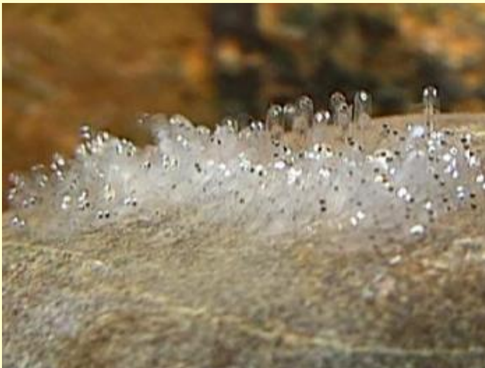
(石に産み付けられたふ化直前の卵)