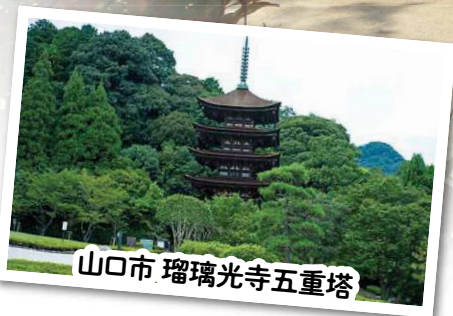
山口市 瑠璃光寺五重塔