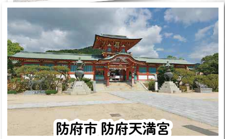
防府市 防府天満宮