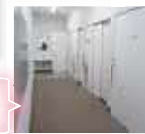
扉は全て引き戸になっています。