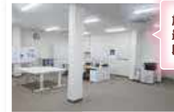
施設内の壁は最小限にとどめ、段差もありません。

各職場の監理係長（職場での世話役）を巻き込んだ活動をし情報発信を心がけています。例えば、洗車の依頼を受けた場合、支援者が職場に車を受け取りに行き洗車後、納車する方法もありましたが、あえて職場の人にはゆうゆうてらすまで納車、引き取りをして頂き、障害者の方と触れ合う場を設けることで理解して貰うと共に障害者の方には自分たちが行った仕事が役に立っているという実感を感じて貰い、モチベーション維持・向上に繋げていきたいと思っています。