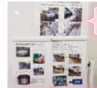
従業員からの御礼のメッセージ