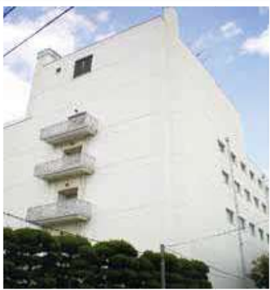
【事務センター 事務集中室】