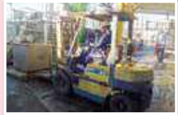
桶内、フォークリフト作業中