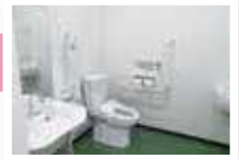
多目的トイレの設置

将来的に車いすの方の採用も視野に入れバリアフリー、多目的トイレの設置をしました。入口のドアも自動ドアになっております。支援者と障害者の方が仲良く一緒に過ごせるように壁は最小限にして常に身近な存在と感じれるようにしています。休憩場所は小上がりの量にして車いすの方も座りやすい高さにしたこと、また量にすることで体調不良時にもゆっくり休息出来るように工夫しております。