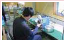
水漏れ防止のシールテープを巻き付ける作業