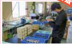
部品がきちんと閉まっているかの確認作業