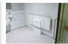
(鏡や持ち手の位置は、車いすを利用する従業員にアドバイスをもらった)