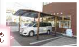
2台分の屋根で雨天時でも洗車可能で予定変更なし