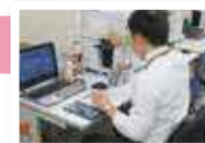
名刺の注文は社員ならだれでも可能