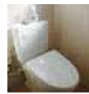
※和式トイレから洋式トイレに改修