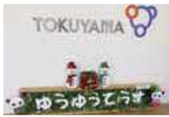
「ゆうゆうてらす」の文字は支援学校の生徒さんが作成

2020年4月に「とくちやれ（トクヤマチャレンジ）」の1テーマとして“新しい仕事を創出し障害者雇用を増やしていこう”というテーマが挙がりました。社内から有志が集まり、勉強会から始まり、近隣企業様、支援施設様や支援学校様の見学等をさせて頂きながら知識を増やして行きました。（百聞は一見に如かずです）雇用推進の拠点となる事務所は「ゆうゆうてらす」と名付け、社内外の人が気軽に立ち寄れる場所にしたいと従業員門の傍の構外にゆうゆうてらすを設置することで、存在・活動をアピール出来るようにしました。2021年4月には障害者雇用推進の専属担当者を配置して、近隣の支援学校から実習を受け入れ2022年4月に、第1期生を採用し、活動をはじめております。