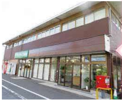
従業員が毎日通る道沿いに事務所が設置されています。