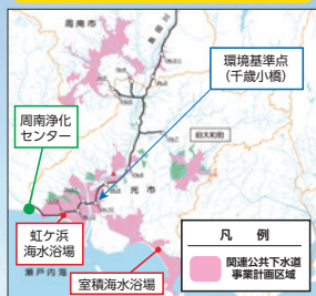
周南浄化センターの周辺位置図

光市の虹ヶ浜・室積両海水浴場は、「快水浴場百選」「日本の渚・百選」に選定され、毎年多くの人々で賑わう美しい海水浴場です。(両海水浴場とも水質「AA」)