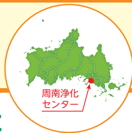
周南浄化センター

光市の虹ヶ浜・室積両海水浴場は、「快水浴場百選」「日本の渚・百選」に選定され、毎年多くの人々で賑わう美しい海水浴場です。(両海水浴場とも水質「AA」)