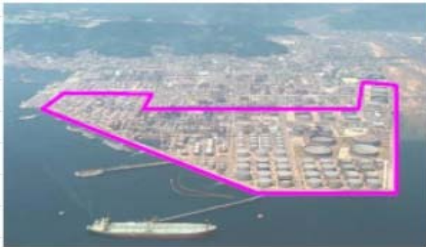
麻里布製油所製造工程

現在は、ENEOSグループの本州最西端製油所として、中国、四国、九州、北陸地方に石油製品を供給する大事な使命を担い、限りある資源の有効活用と環境にやさしい製油所として地域に密着した企業を目指しています。