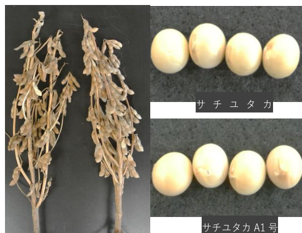
図 1 成熟期の草姿と子実

注) 試験年次は下関市が平成 29 年～30 年、柳井市が平成 29 年～令和元年、阿武町が平成 29 年～令和元年。