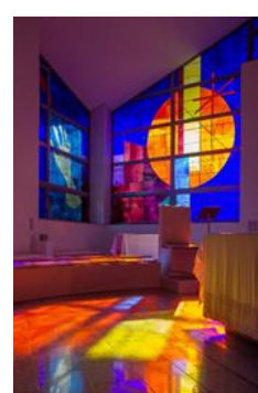
山口サビエル 記念聖堂 (山口市)