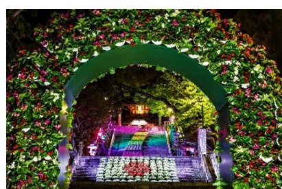
防府天満宮(防府市)