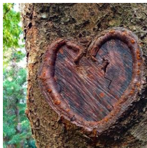
ときわ公園(宇部市)