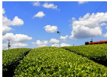
藤河内茶園(宇部市)