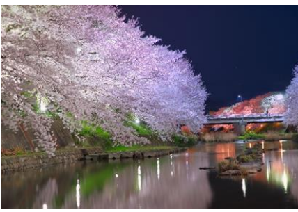
市役所側の桜(美祢市)