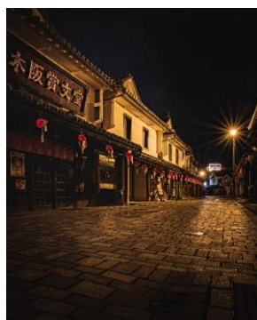
白壁の街並み(柳井市)