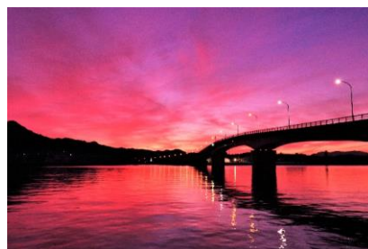
南周防大橋(平生町)