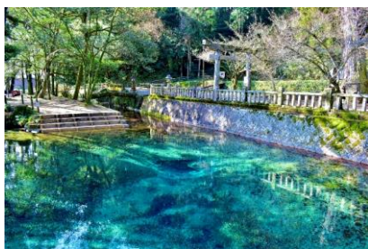
別府弁天池(美祢市)