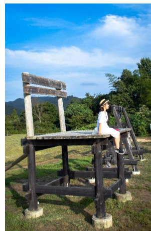
三丘ゆめ広場(周南市)