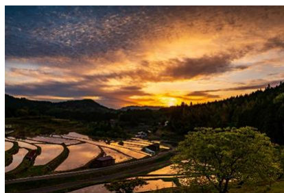
中須北の棚田(周南市)