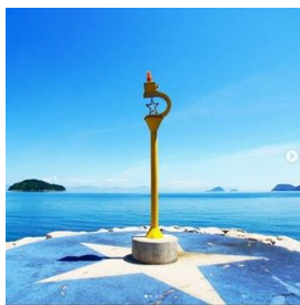
星のビーチ(周防大島町)