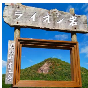
ライオン岩(周南市)