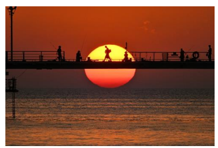
フィッシングパーク光(光市)