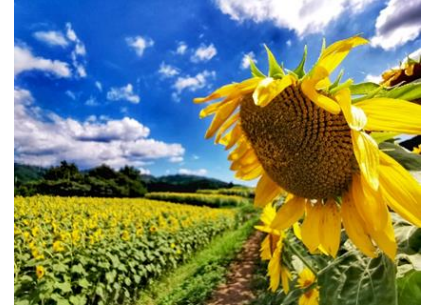
むつみひまわりロード(萩市)