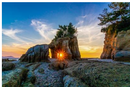
くぐり岩(山陽小野田市)