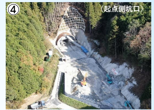
④ 雲雀山(2号)トンネルの施工状況