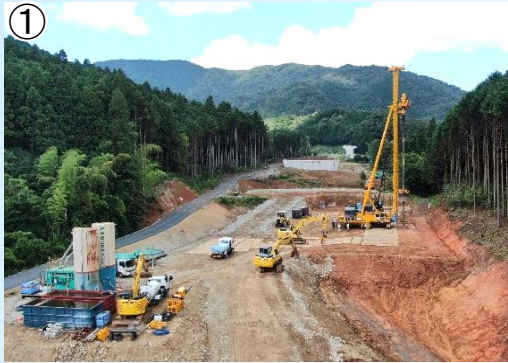
① (仮)絵堂北IC付近から北側の状況