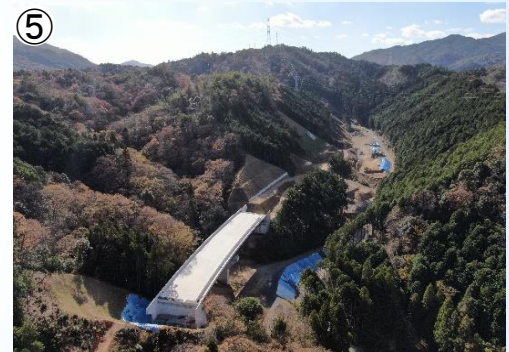
⑤ 4号橋付近から南側の状況