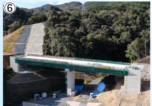
⑥ 9号橋上部工の施工状況