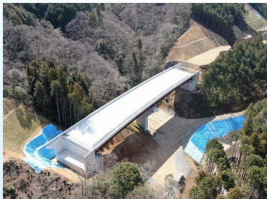
4号橋(仮称) 上部工完成 (R3. 4)