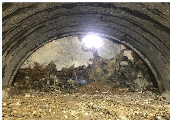
東の山トンネル 貫通状況 (R3. 4)

橋梁については、令和2年8月から工事着手した「4号橋(仮称)上部工」(L=84m)の施工が、令和3年4月に完成しました。また、令和3年9月に「9号橋(仮称)上部工」(L=72m)の主桁架設が完了し、現在、壁高欄(壁部のコンクリート打設)の施工を実施しています。