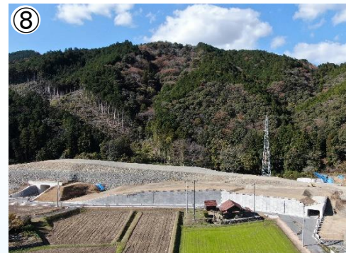
⑧ 補強土壁工等の施工状況