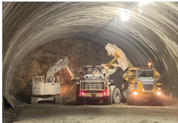
雲雀山トンネル 掘削状況 (R3. 11)