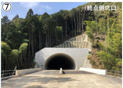
⑦ 角力場(3号)トンネルの状況