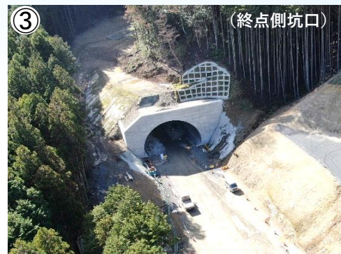
③ 東の山(1号)トンネルの施工状況