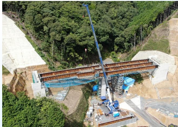
9号橋(仮称) 主桁架設状況 (R3. 9)