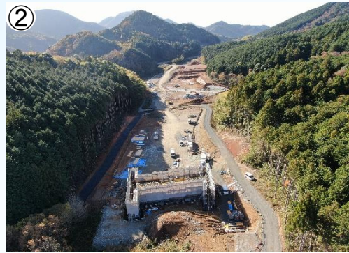
② ボックスカルバート等の施工状況